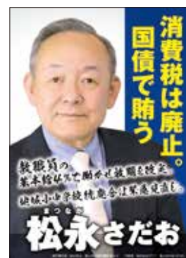
令和5年度富山県議会選挙 掲示ポスター